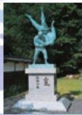
西郷四郎像 西郷頼母の長男西郷四郎は、幕末維新の英雄として薩長四天王の一人に数えられ、大坂山崎で近代無双を誇りました。その偉業を偲び、西郷表門前に西郷像が建立されました。