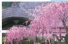
桜まつり (4月中旬~下旬)

会津武家屋敷は、七千坪の敷地に会津藩家老西郷頼母邸を中心に、重要文化財の田中畑陣屋、数寄屋風茶室、藩米精米所、会津歴史資料館、心の美術館などの歴史的建造物が軒を連ねるミュージアムパークとして開門しております。 在りし日の会津武士の生活を偲び、四季折々の風情とともに、ものふの心に触れて頂ければ幸いです。