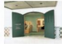
心の美術館 齊 龍

会津の代表的な美芸品赤べこと志草上り小道具、それぞれに楽しいオリジナルの装付けができます。また、ガフスの器(タンブロー、ティーカップ)にグフインダーで絵を彫るガフスの絵彫り。こちらも独創的な美品らしいコップを作ってください。